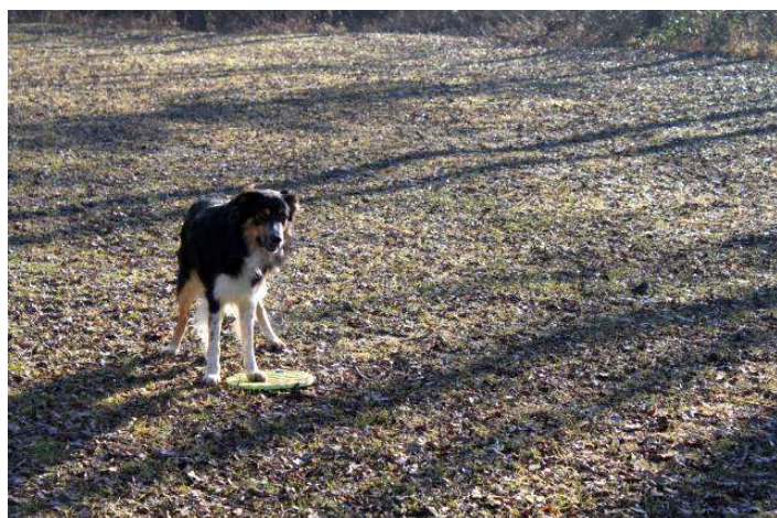
Präzision in der Box: mit dem Bodentarget