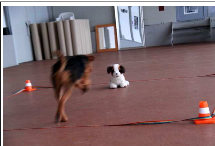
Tempo in die Box: mit Spielzeug