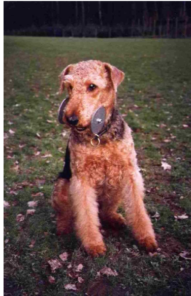
Unico mit Metallgegenstand

In der Klasse Beginners und Klasse 1 dürfen Sie noch mit dem Arm ein Hilfezeichen für das Springen geben, aber in den Klassen 2 + 3 gilt das Armzeichen als Doppelkommando. Darum üben Sie am besten bereits von Anfang an ohne Körperhilfen!