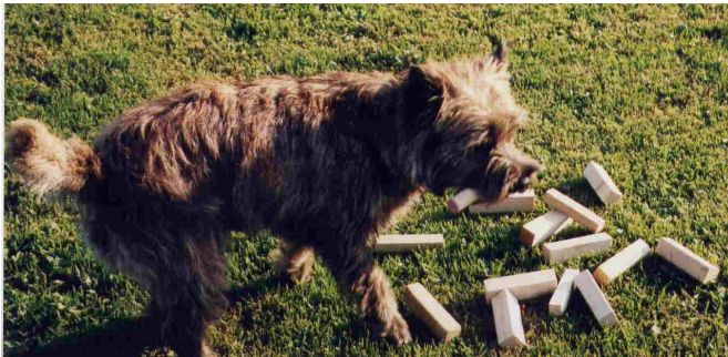
Er hat es gefunden und in den Fang genommen...