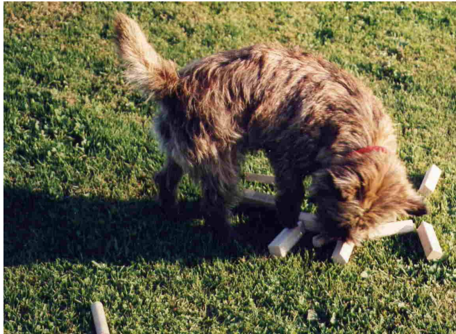
Der Hund sucht konzentriert...