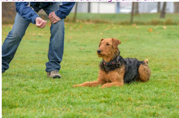
Ablenkung bei den Positionen trainieren